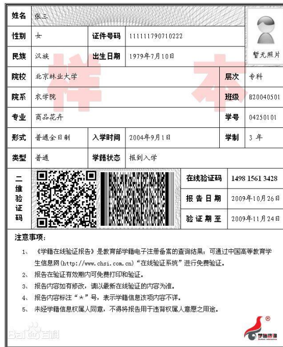
教育部学籍在线验证报告

2、济南户籍的应届非全日制成人高校本科毕业生还须上传（1）“中国高等教育学生信息网”的《教育部学籍在线验证报告》；（2）户口本首页、索引页及个人单页（集体户口仅提供首页及个人单页）。